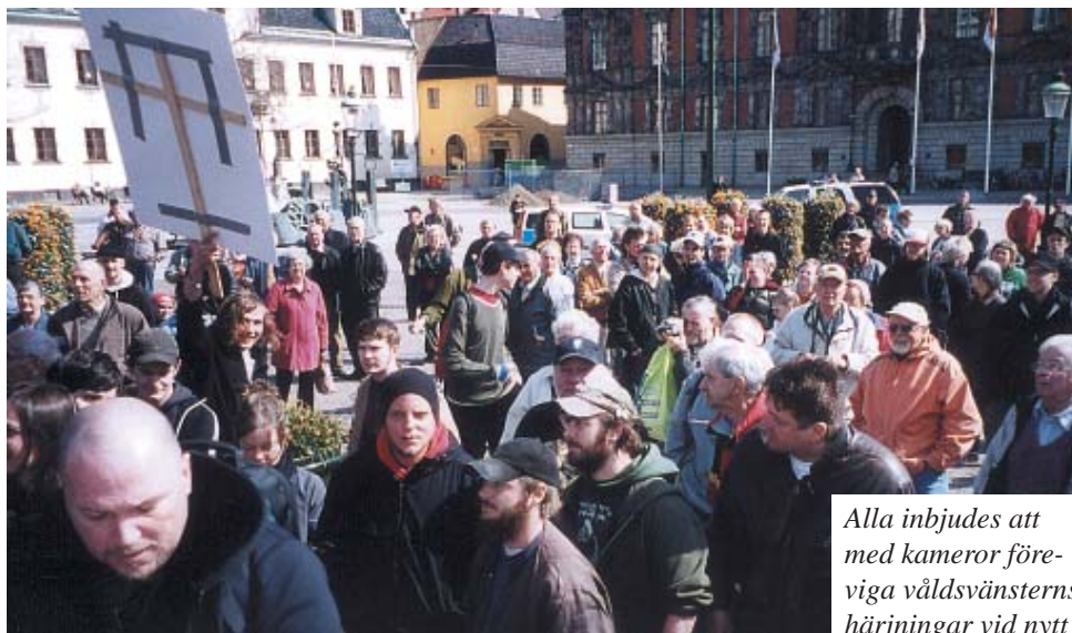
Ovan två foton från mötet 20040429. Nedan polisärende efter mötet.

BrB 16:4 § Om någon genom våldshandling eller oljud eller på annat dylikt sätt stör eller söker hindra allmän gudstjänst, annan allmän andaktsövning, vigsel eller begravning eller dylikt akt, domstols förhandling eller annan statlig eller kommunal förrättning eller ock allmän sammankomst för överläggning, undervisning eller åhörande av föredrag, dömes för störande av förrättning eller av allmän sammankomst till böter eller fängelse i högst sex månader.