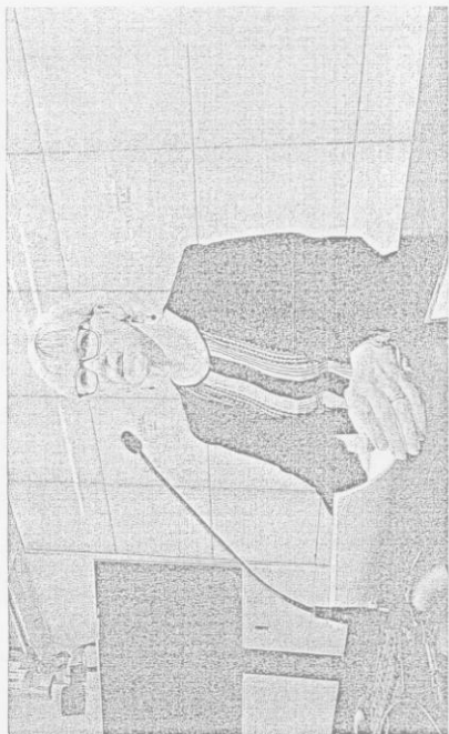
Den 17 mars hölls ett pressmöte i Stockholm där den svenska regeringen presenterade sina åsikter om den saudiska regeringen.